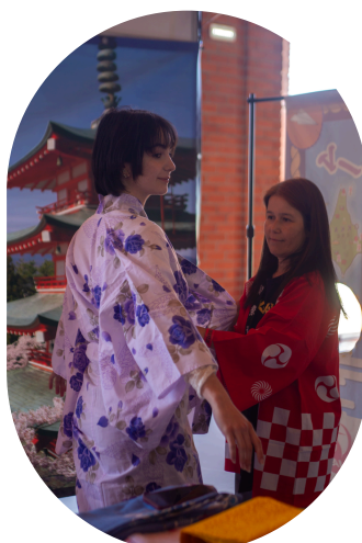
(Atividade “Vestir Yukata”)