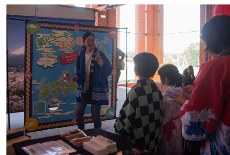
(Atividade “Avião de Papel”)