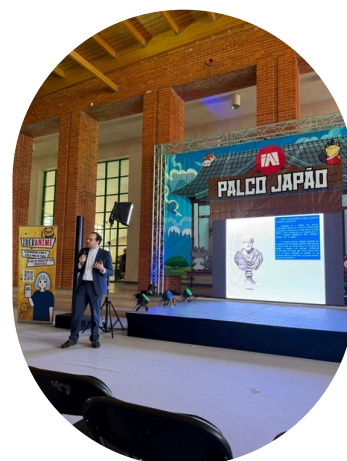
(Palestra Miguel Patricio Sobre Cinema Japonês)