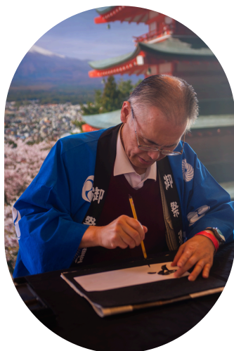
(Atividade “O teu nome em Japonês”)