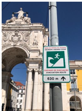
コメルシオ広場 標識