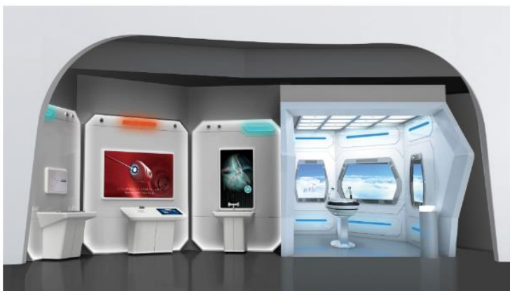
▲PASONA NATUREVERSE 『未来の医療』展示イメージ