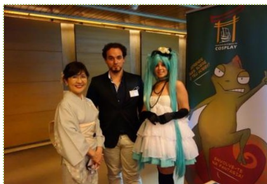
Ministra Inada com alguns dos membros da JapanNET