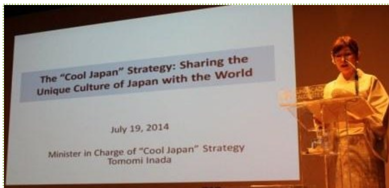
Ministra Inada a proferir a conferência

Decorreu, no passado dia 19 de Julho, na Fundação Calouste Gulbenkian em Lisboa, a conferência sobre o plano de acção de promoção do “Cool Japan”.