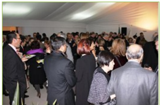
Convidados na sala da receção