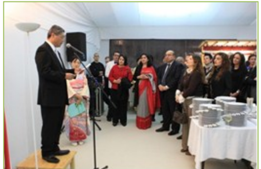
O Embaixador Azuma profere palavras de saudação aos convidados