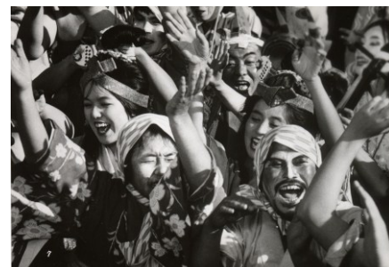
Filme: "Eijanaika or Why Not?" (1981) Realizador: Shohei Imamura