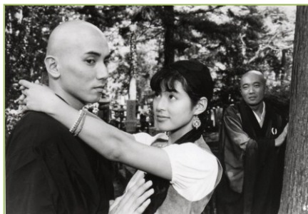
Filme: "Fancy Dance" (1989) Realizador: Masayuki Sudo