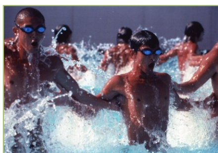
Filme: "Water Boys" (2001) Realizador: Shinobu Yaguchi