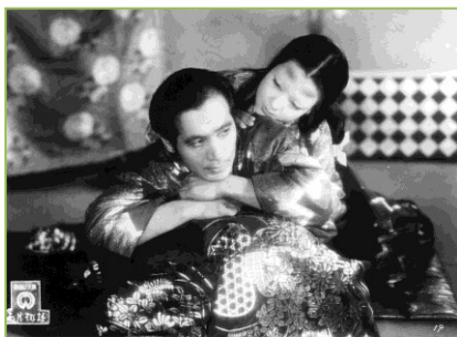
Filme: "The Ugetsu Story" (1953) Realizador: Kenji Mizoguchi