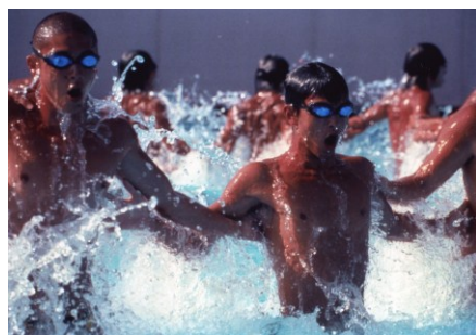
Filme: “Water Boys” (2001) Realizador: Shinobu Yaguchi