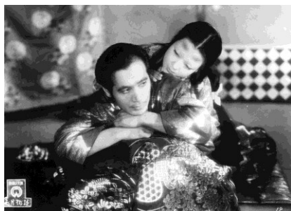
Filme: “The Ugetsu Story” (1953) Realizador: Kenji Mizoguchi