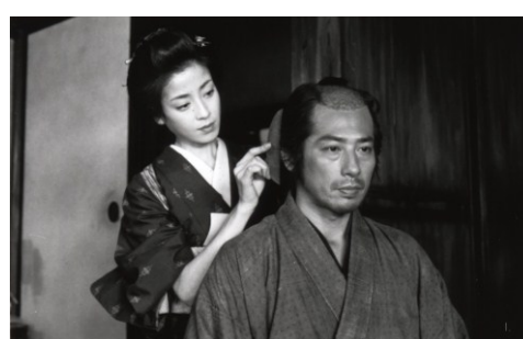
Filme: “The Twilight Samurai” (2002) Realizador: Yoji Yamada