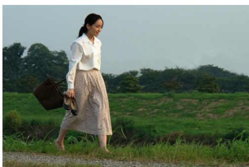
Filme: “Yunagi City, Sakura Country” (2007) Realizador: Kiyoshi Sasabe