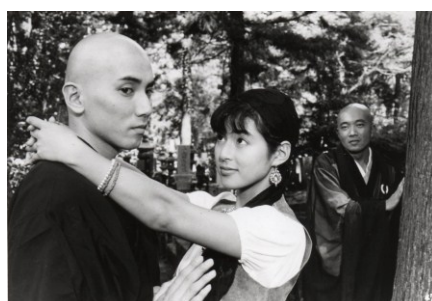
Filme: “Fancy Dance” (1989) Realizador: Masayuki Suo