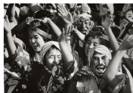
Filme: “Eijanaika or Why Not” (1981) Realizador: Shohei Imamura