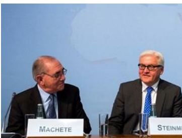
(マシェッテ外相(左))

マシェッテ外相はドイツを訪問し、シュタインマイヤー独外相と会談を行った後、第2回ポルトガル・ドイツ・フォーラムの冒頭演説で、ポルトガル経済状況や両国間関係について述べた。同外相は、ポルトガル国民の努力はドイツで評価されているとし、同国におけるポルトガル人コミュニティもポルトガルのイメージ向上に貢献していると強調した。また、ポルトガルとドイツは政治・経済面で強固な友好関係を築き、ドイツはポルトガルにとり輸出入共に第2の貿易相手国であると述べた。更に、対ポルトガル投資はブラジル、アンゴラ、モザンビーク等ポルトガル語圏諸国への足がかりとなり、欧州、南米、アフリカを繋ぐ地理的優位性を持っていると述べた。他方、シュタインマイヤー独外相は、ポルトガルの財政再建は大きく進展しており、経済危機を克服しつつあるが、欧州議会選挙における反欧州勢力の拡大等、政治危機には懸念があると指摘した。