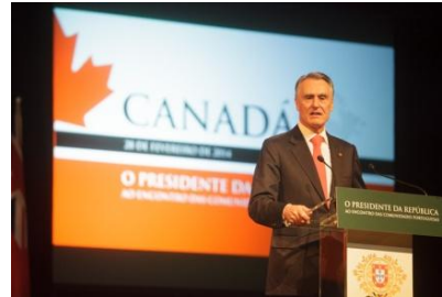
(ポルトガル人コミュニティ会合で演説するカヴァコ・シルヴァ大統領)

1950 年代からであり、これまで同国最大規模の外国人コミュニティの一つとして、活躍していると述べた。更に、ポルトガル人の海外移住は真の戦略的資産であり、定住国においてポルトガルの使節となるべきであると述べた、そして、信頼可能でダイナミックな国としてのポルトガルのイメージを確立させるよう期待している旨付言した。