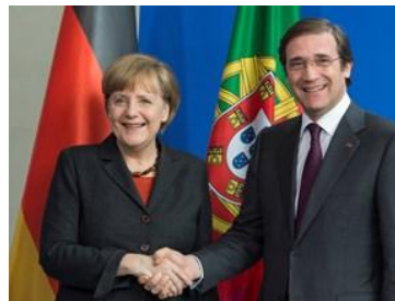
(パソス・コエーリョ首相(右)：政府HPから転載)

パソス・コエーリョ首相はドイツを訪問し、メルケル独首相とのワーキングランチ後、共同記者会見を行った。パソス・コエーリョ首相は、トロイカ支援プログラムを成功裡に終えつつあり、経済成長及び雇用創出について明るい兆しが見えてきたと述べ、同プログラム終了後に取りべき選択肢ははまだ決定していないと強調した。また、メルケル独首相は、ポルトガルの財政再建を称賛すると共に、ポルトガル政府のいかなる決断も支援すると述べた。更に、両首相はウクライナ情勢についても意見交換し、対話の重要性を再確認した。