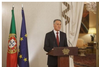
(声明を読み上げるカヴァコ・シルヴァ大統領:)

カヴァコ・シルヴァ大統領は、欧州議会選挙のポルトガルにおける投票日を5月25日に正式決定すると共に、ポルトガルと欧州の将来は相互に繋がっていることから、国民が欧州議会選挙に積極的に参加することは重要であると述べた。また、ポルトガルは財政再建プログラム終了後の進むべき道を明確にしなければならず、各党は責任感を持って相互に議論すべきであると強調した。