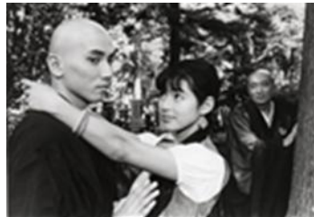
「ファンシィダンス」 (周防正行、1989年)