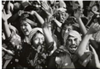
「ええじゃないか」 (今村昌平、1981年)

お問い合わせ：21-311-0560 / cultural@lb.mofa.go.jp （日本大使館広報文化班）