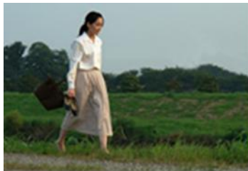
「夕風の街 桜の国」 (佐々部清、2007年)