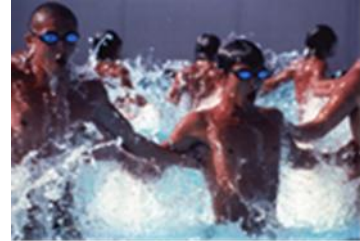
「ウォーターボーイズ」 (矢口史靖、2001年)