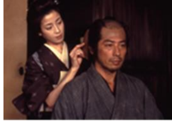
「たそがれ清兵衛」 (山田洋次、2002年)