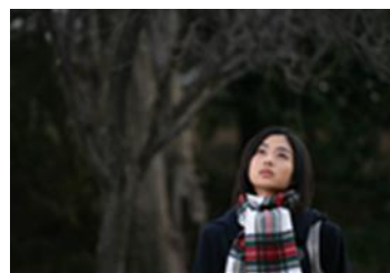
「包帯クラブ」(堤幸彦、2007年)