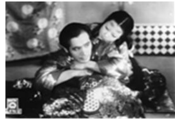
「雨月物語」 (溝口健二、1953年)