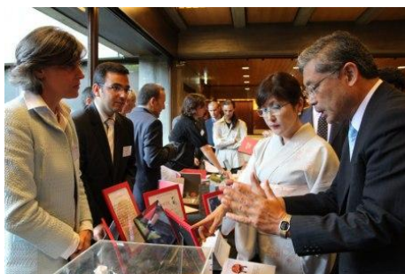
JapanNETのメンバーと歓談する稲田大臣