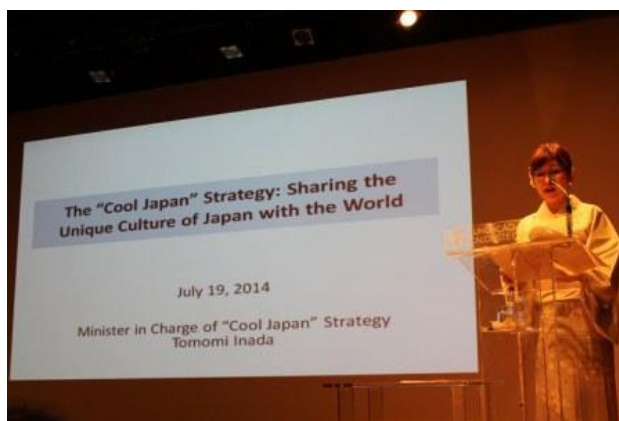
稲田大臣講演の様相

http://www.pt.emb-japan.go.jp/jp/culture/discurso_embaixador_inada.pdf （ポルトガル語）