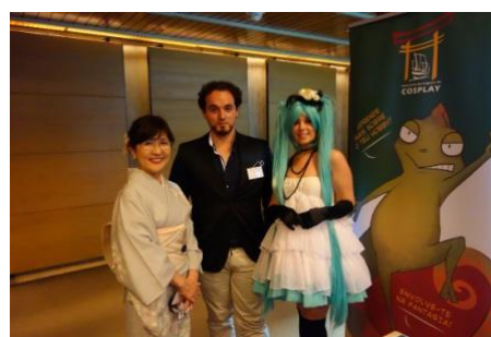
JapanNETのメンバーと記念撮影