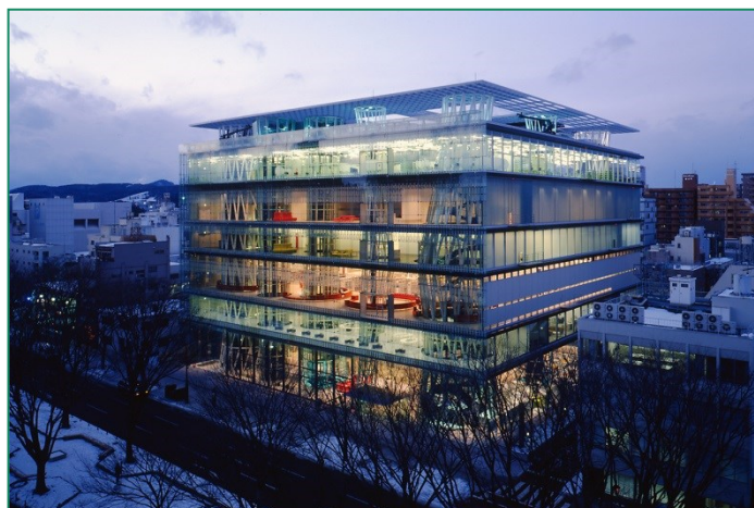
Sendai-mediateque – Copyrights: SHINKENCHIKU-SHA JAPAN ARCHITECT vol.65 “Parallel Nippon”

Mais informações: http://www.museudoorientep.pt/2651/parallel-nippon.htm