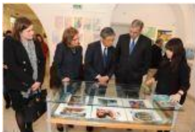
作品に見入る東大使（中央）とカストロ市長（その右）

3月7日（金）、レイリア市において、東博史大使及びラウル・カストロ・レイリア市長列席の下、徳島・レイリア姉妹都市 45 周年記念式典の一環として、徳島市の学生・生徒による友情をテーマとした作品展「友情の色」及び周年記念を始めとする切手展示会のオープニング式典が開催され、大勢の市民が来場しました。